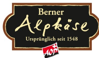
AOP-Signet für vorverpackten Berner Alpkäse