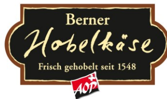
AOP-Signet für vorverpackten Berner Hobelkäse